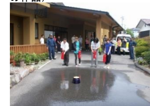
(消防・避難訓練の様子)