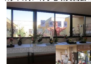
(毎年11月に行う文化祭での華道教室の利用者の作品)