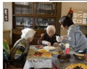
(生活のひとコマ) (ケーキ作りの様子)