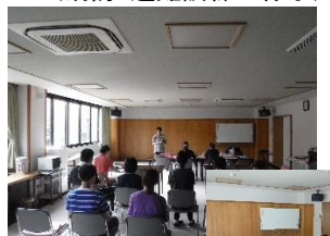
(施設内研修のひとコマ) (ユニット連絡会の様子)→