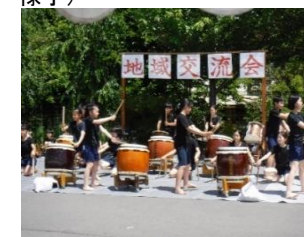
(毎年6月に行う地域交流会の様子)