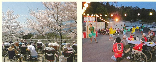
テラスで桜を愛でる 夏のイベント・納涼祭