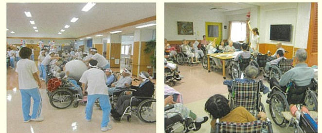
施設行事(運動会)風景 レクリエーションの様子