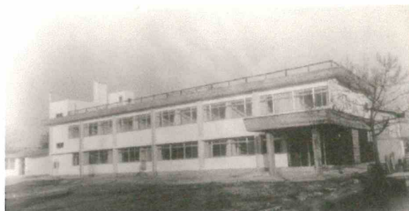
完成直後の黒澤病院全景（昭和43年11月）