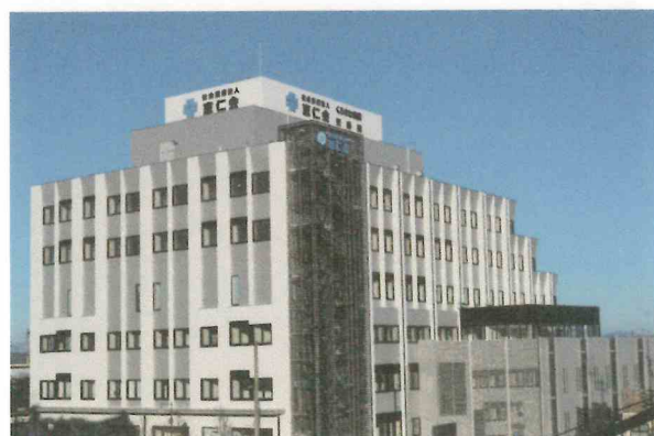
平成29年より中込駅前に新築移転したくろさわ病院