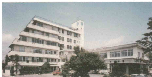
昭和54年病院建物高層化集合住宅完成時の建物全景