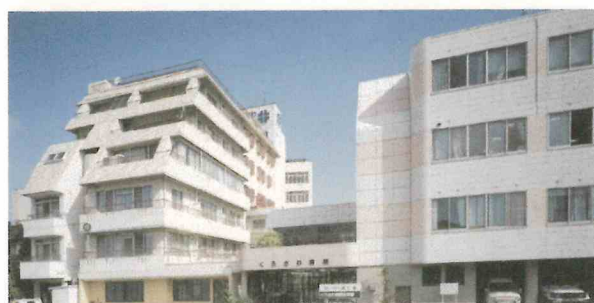
平成5、13年の拡張工事後の建物全景。