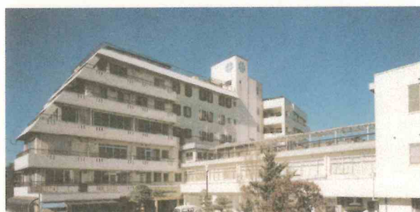
昭和63年病院建物増築時（介護老人保健施設安寿苑開設）の建物全景