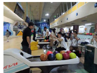
職員レクリエーション大会