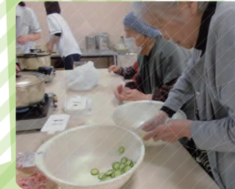
リクエストメニューによる料理クラブ