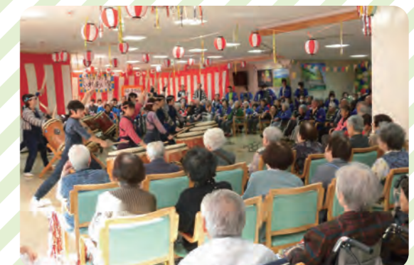
ご家族、地域の方も一緒に参加していただくかりん祭

各月で季節に合わせた様々なイベントを企画しています。ボランティアの方による催しやお出掛けなども行っています。