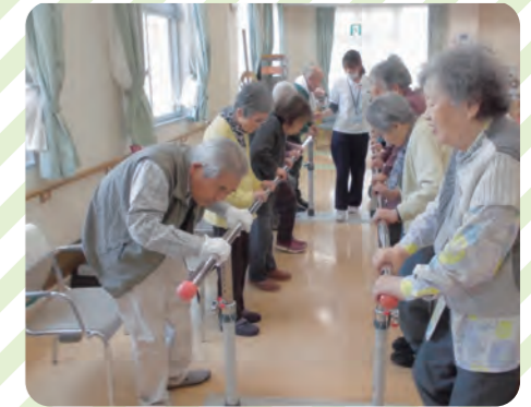
平行棒を使った起立訓練