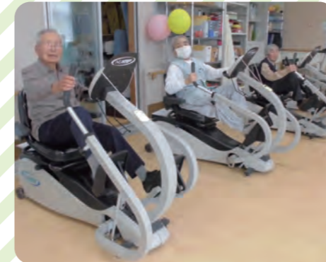
マシントレーニング