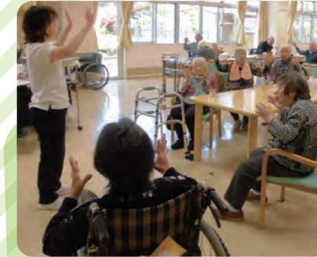
リハビリスタッフによる集団体操