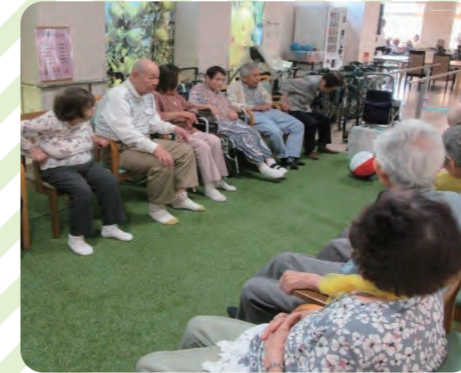
芝生を利用した機能訓練

在宅での生活が継続して出来るように、機能回復や維持を目的に行います。施設内だけでなく、課外活動も積極的におこなっています。