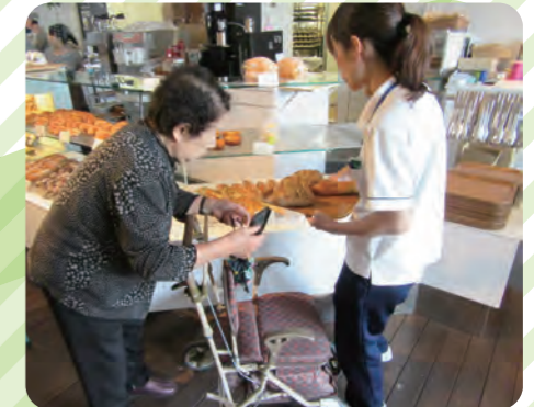
課外活動・お買い物