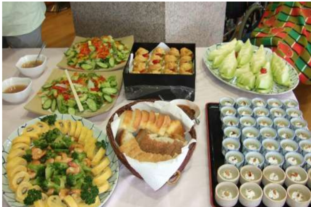
咲楽自前のキッチンスタッフによるバイキング料理！