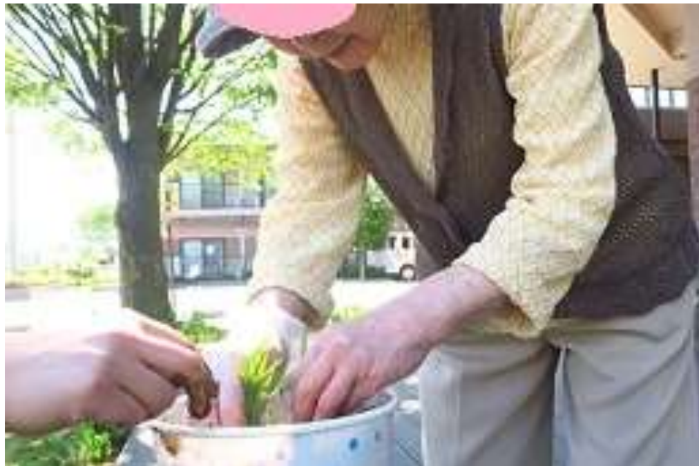
マイポッドによる田植え (通称：咲楽米作り)