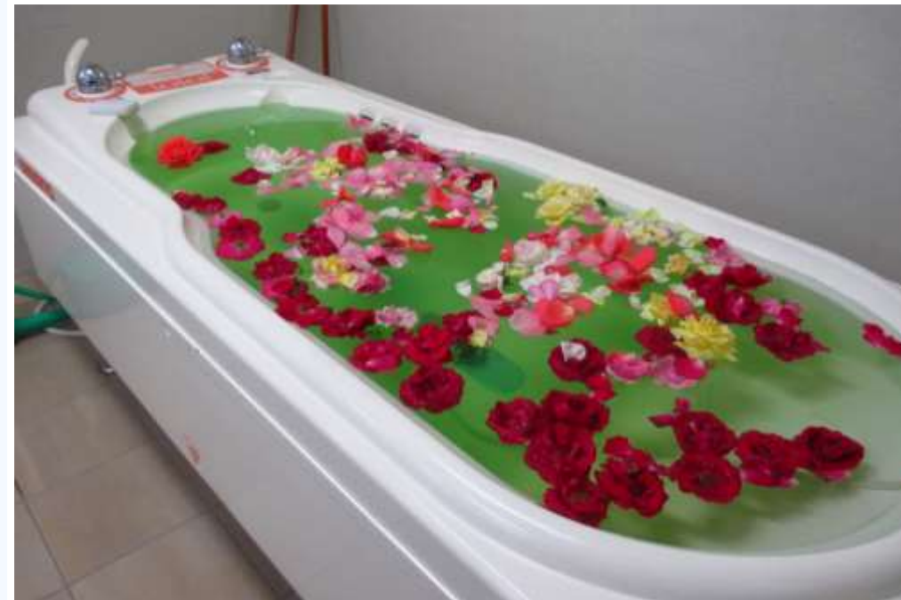
自然な素材をつかった「お楽しみ風呂」