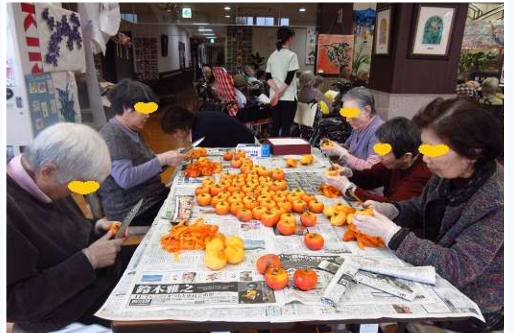
毎年恒例の干し柿作り！ 約1300個作った年もあります！