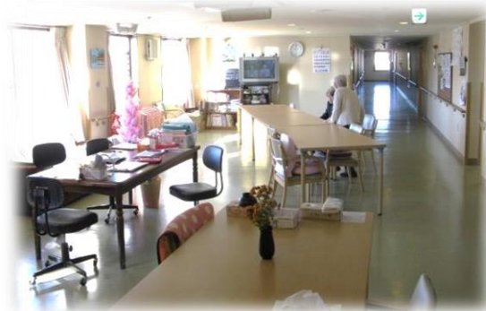
▲リビングと居室に続く廊下