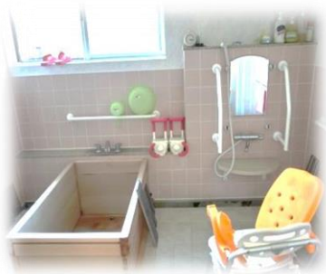
▲浴室 個浴 檜風呂