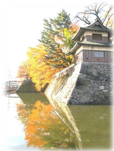
▲高島城公園の紅葉

事業所名 特定施設入居者生活介護事業所 ころ高島 名称 特定ころ高島 住所 諏訪市高島三丁目1300番1号 連絡先 0266-54-5567 (1・2階) 0266-54-5568 (3階) 登録定員数 38名