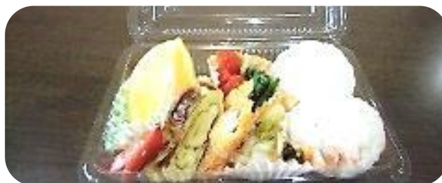
▲皆で作って、「いただきます。」（花見弁当）