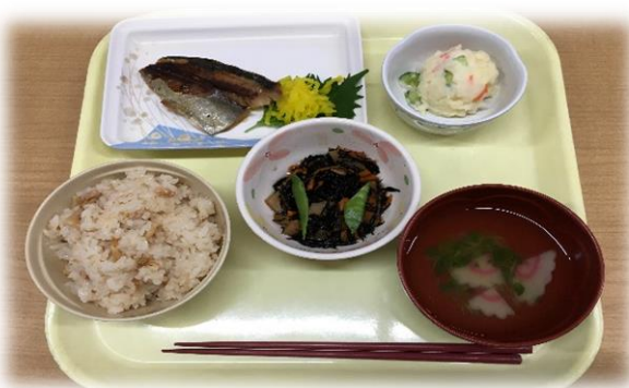
▲栄養バランスのとれたお食事です。 ご利用者に合わせた食事形態で提供いたします。

お風呂は個浴ですのでお一人ずつゆっくり入っていただけます。また温泉ですので、体の芯まで温まることができ好評です。