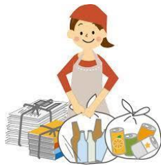
整理整頓・障子貼・ゴミ出し・ストーブ給油 動物の世話・家具の移動