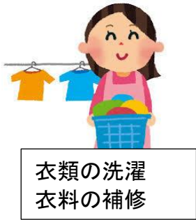
衣類の洗濯 衣料の補修