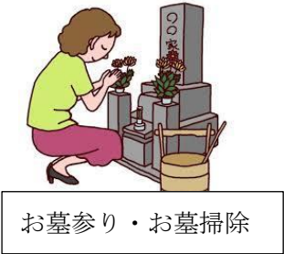
お墓参り・お墓掃除