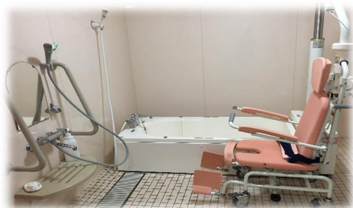
▲リフト浴もありますので 安心して入浴していただけます。