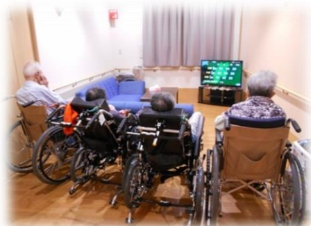
▲キッチン（写真上左）とリビング（写真上右）

あおば歯科クリニックの先生には、定期的に往診していただき、口腔内の管理をしていただいております。