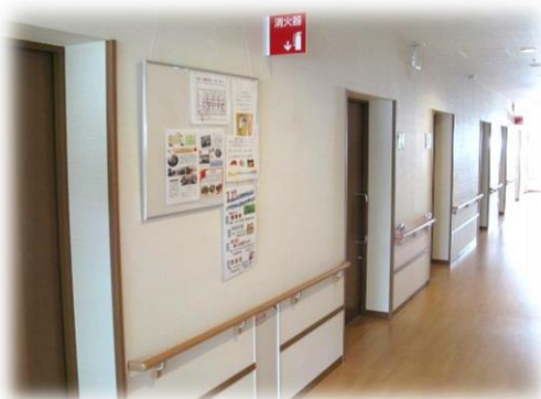
▲居室出入り口と廊下

各階には、リビングがあり、食事やレクリエーションが楽しめます。共同浴室(無料)・洗濯室(コインランドリー)もあります。