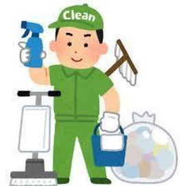
掃除・窓ふき・住宅関連修理