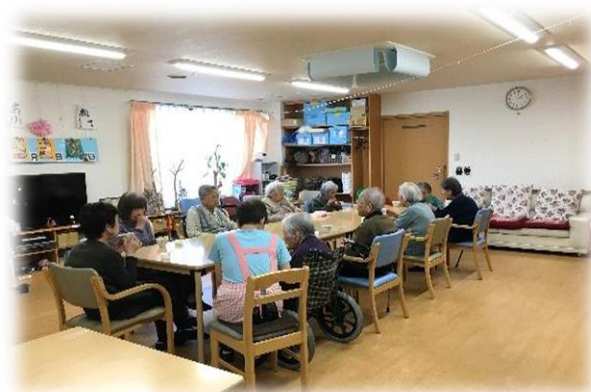
▲お部屋は床暖房でとても暖かく過ごせます。