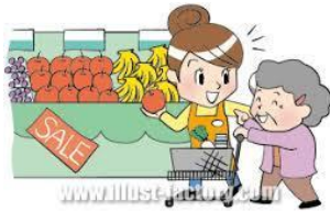
買い物・銀行・役所・習い事・施設・食事等の同行