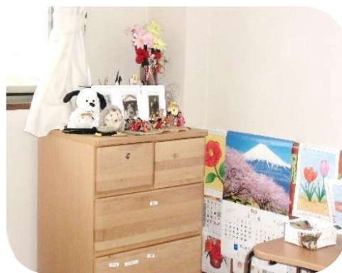
▲趣味の作品がいっぱい