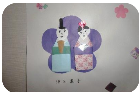
▲個人の力作（おひな様）