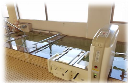
▲高島の温泉 手前はリフト浴

ころ高島の1階(5室) 2階(15室)・3階(18室) に居室があり、38名の入居施設です。