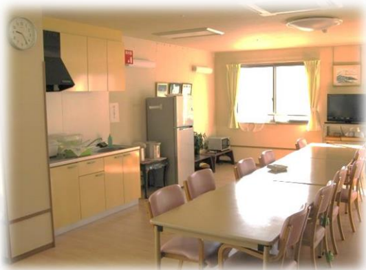
▲共同キッチンとリビング

事業所名 ころのひろば 特定施設入居者生活介護事業所 名称 ころのひろば特定 住所 諏訪市高島一丁目21番14号 連絡先 0266-54-5612 登録定員数 40名