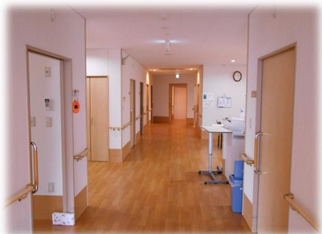
▲（写真上；居室・リビングに続く廊下）

地域の皆さんやご家族の方のご協力をいただきながら、ゆっくりと穏やかな生活を送っていただけます。