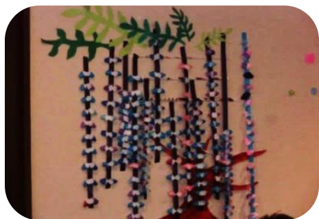
▲皆で作りました（藤の花）