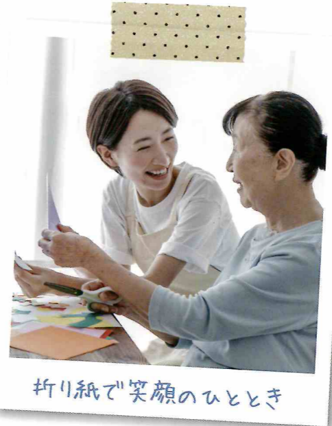
折り紙で笑顔のひととき