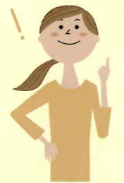
有資格者 介護福祉士 保育士等