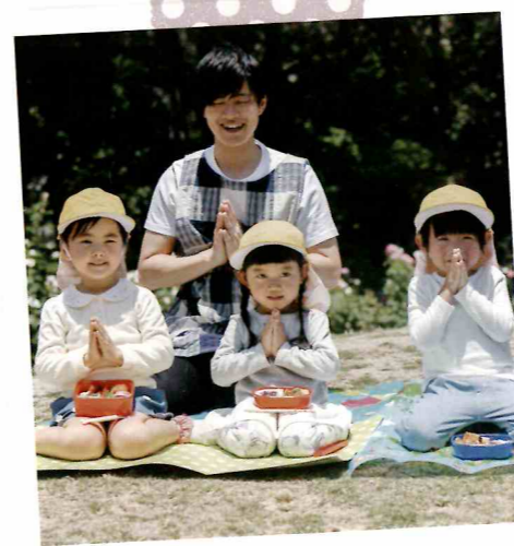
みんな一緒に「いただきます」